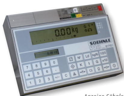
Anzeige Söhnle (gebraucht)