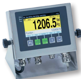
Anzeige IT 1 (neu)