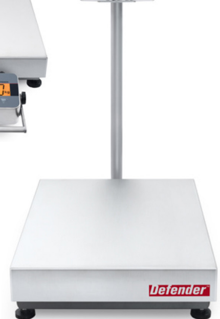
Hybridwaage mit Säulenmontage