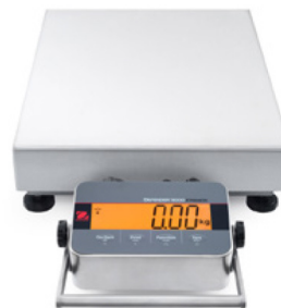
Hybridwaage mit Frontmontage