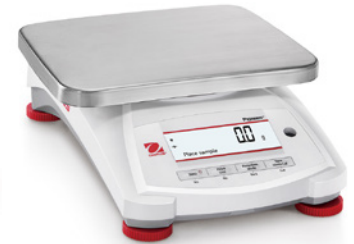
Modell PX12001 und PX12001/E

Vier Schnelltasten ermöglichen die einfache Bedienung mehrerer Wägemodi.